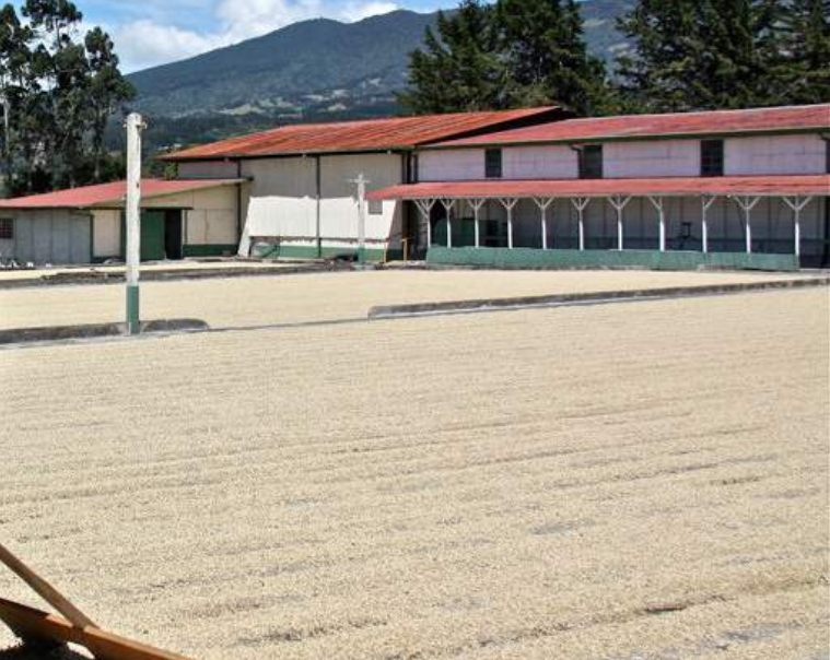
Secado de café en Alajuela, Costa Rica.

así como, contribuyendo a la conservación de este importante recurso natural, con una consideración especial de los desafíos y necesidades de la agricultura familiar en el Corredor Seco Centroamericano y las zonas áridas de República Dominicana. Esta apremiante tarea regional debe enfrentarse intersectorialmente con el concurso de la institucionalidad del SICA con un enfoque de gestión integral del recurso hídrico.