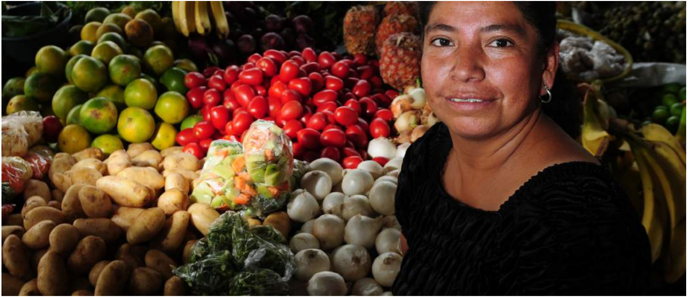
Mercado en Ciudad de Guatemala