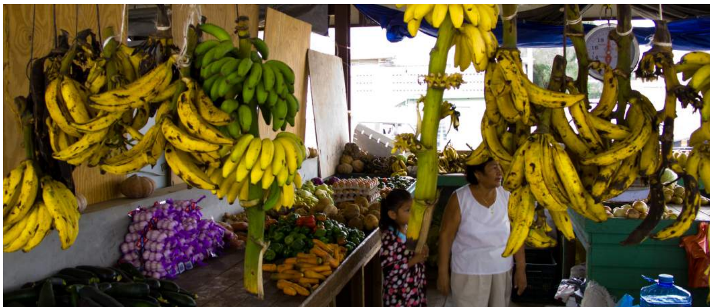
Mercado en San Ignacio, Belice