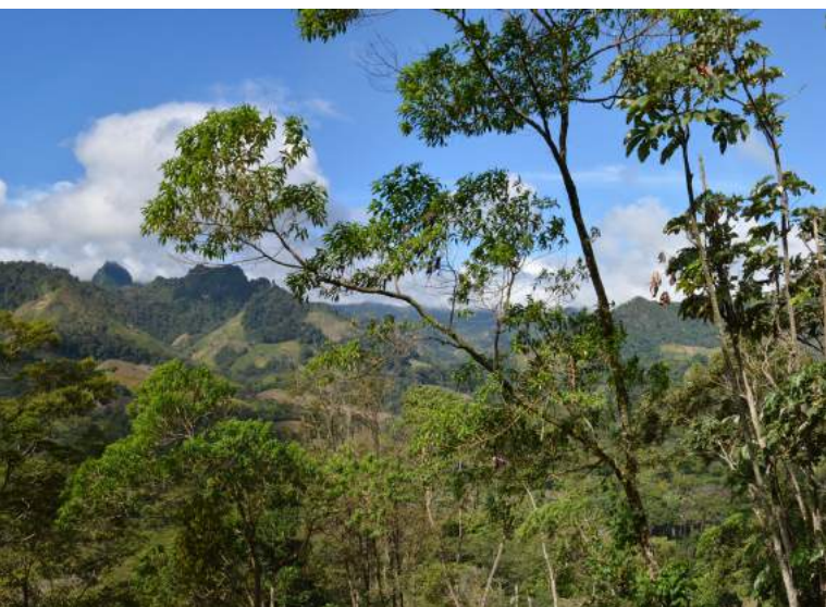
Macizo de Peñas Blancas, Matagalpa, Nicaragua.

El informe de CEPAL añade que las sequías también han impactado con fuerza en la región, con episodios muy serios en los años 2001 y 2009. Los trece mayores eventos extremos en la región desde 1974 que han sido evaluados por los Gobiernos y la CEPAL arrojaron pérdidas y daños totales de aproximadamente USD 28.000 millones (a precios del 2008). De ese monto, un 33% correspondió a los sectores productivos y de esta proporción, el 68% recayó en el sector agropecuario (CEPAL, 2013). A partir de 2014, han sucedido episodios de sequía que han afectado primordialmente el Corredor Seco Centroamericano y han provocado pérdidas y daños importantes incluyendo la producción de los granos básicos.