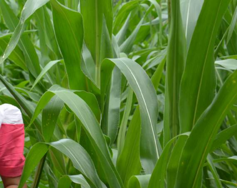
Milpa en Chiquimula, Guatemala.

mas (CEPAL, 2012) los bosques han evolucionado a lo largo de los milenios debido a los cambios progresivos del clima y la geología. Ahora están amenazados como nunca antes por la velocidad e intensidad de la presión directa de las actividades humanas y del cambio climático provocado por estas actividades. Dicho estudio identifica como posibles impactos del cambio climático en los ecosistemas naturales: cambios en los patrones de evaporación, alteración de la cobertura nubosa a nivel de la vegetación, perturbación de los ecosistemas de montaña, disminución de los pisos tropical, montano y aumento del piso premontano, aparición del bosque muy seco tropical y del bosque seco premontano. Podrían ocurrir también pérdidas de hábitat por la mayor incidencia de incendios forestales, sequías, inundaciones y cambios en los sedimentos del suelo en tierras bajas. En consecuencia, pueden propagarse especies invasoras y nuevos vectores de enfermedades.