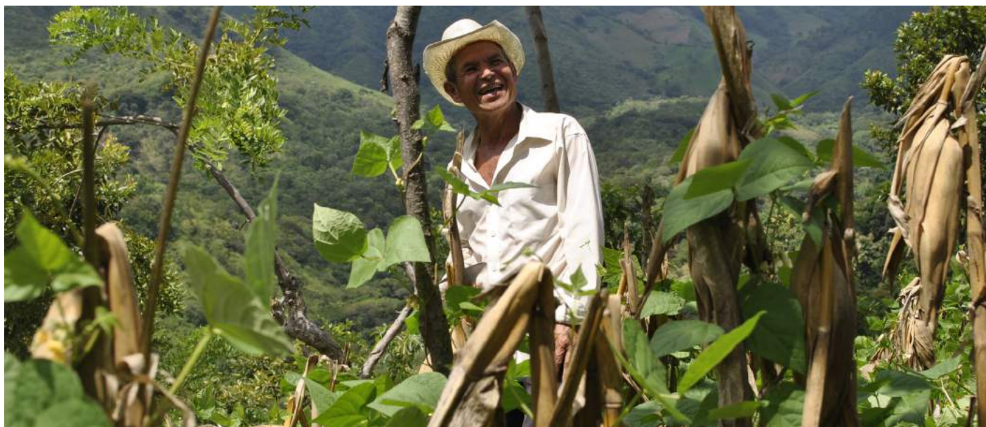
Proyecto ABES en Chalatenango, El Salvador.