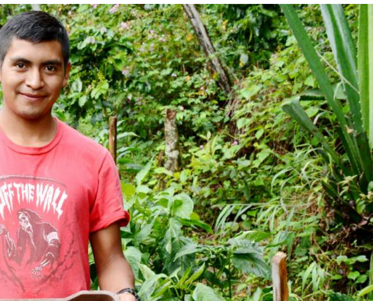
Productores de hortalizas en Intibucá, Honduras.

En estas circunstancias, resulta imperativo incrementar la resiliencia y fortalecer las capacidades