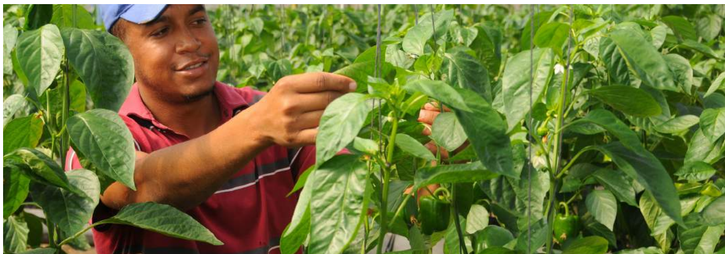
Plantaciones de ají en Santiago, RD