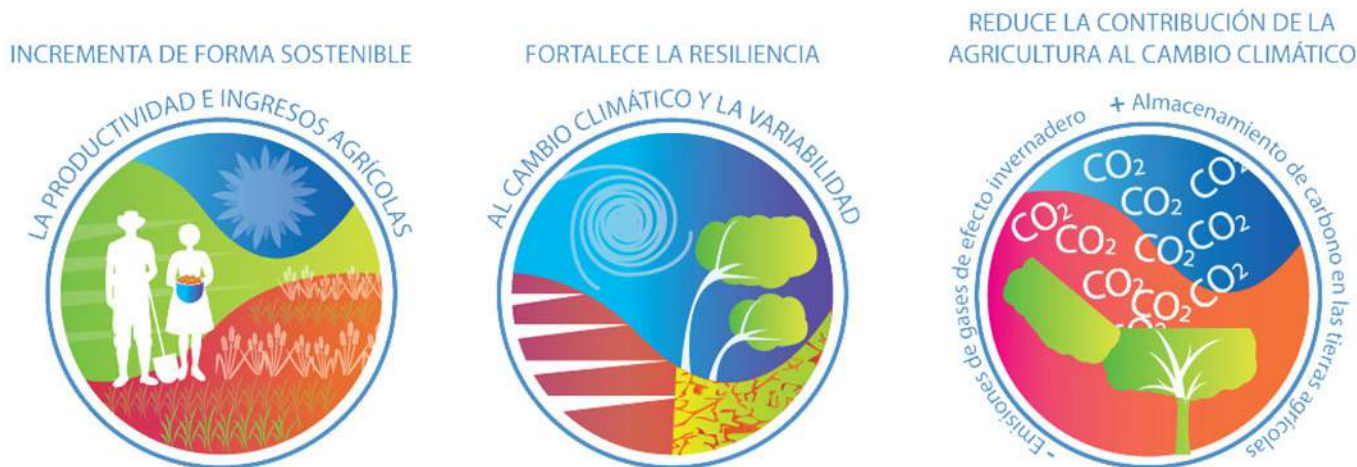
Figura 1. Representación de los pilares de la ASAC.

Territorio: Se adopta el concepto de territorio contenido en la Estrategia Centroamericana de Desarrollo Rural Territorial (ECADERT), que lo define como una unidad geográfica compuesta por un tejido social propio que se encuentra asentada en una base de recursos naturales, que presenta ciertas formas de producción, consumo e intercambio, que está regida por instituciones y formas de organización particulares, las cuales dan origen y, a la vez, expresan una identidad y un sentido de propósitos compartidos por múltiples agentes públicos y privados. Se considera al territorio como un espacio físico y multicultural en el cual las personas que lo habitan comparten una historia y un sentido de pertenencia.