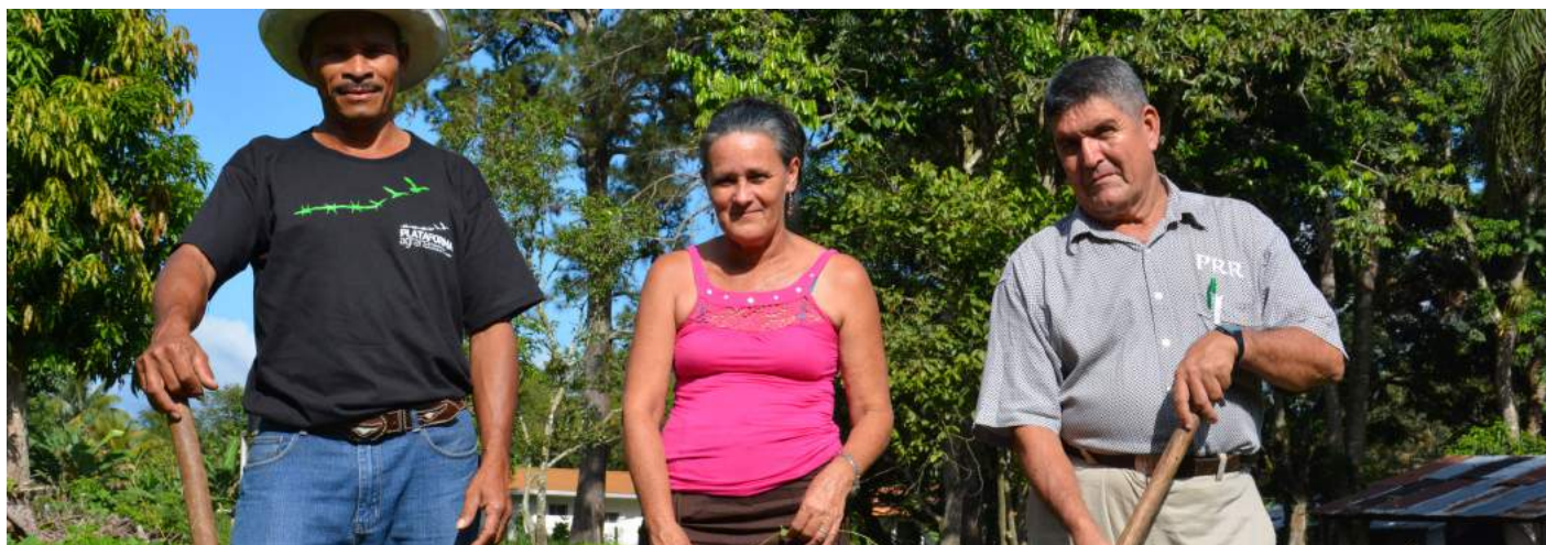
EPM de frijol en Santa Bárbara, Honduras.