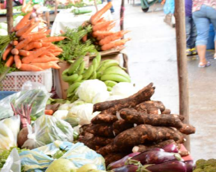
Mercados de Managua, Nicaragua.

limpias. Las acciones de uso eficiente y sostenible de los recursos naturales de este sector contribuyen con la prestación de servicios ambientales como la conservación de la rica diversidad biológica con la que cuenta la región, la conservación del agua, suelo y bosque; además, de su aporte al paisaje, entre otros. Este sector es una fuente de prosperidad para los territorios rurales y un motor de las economías de la región.